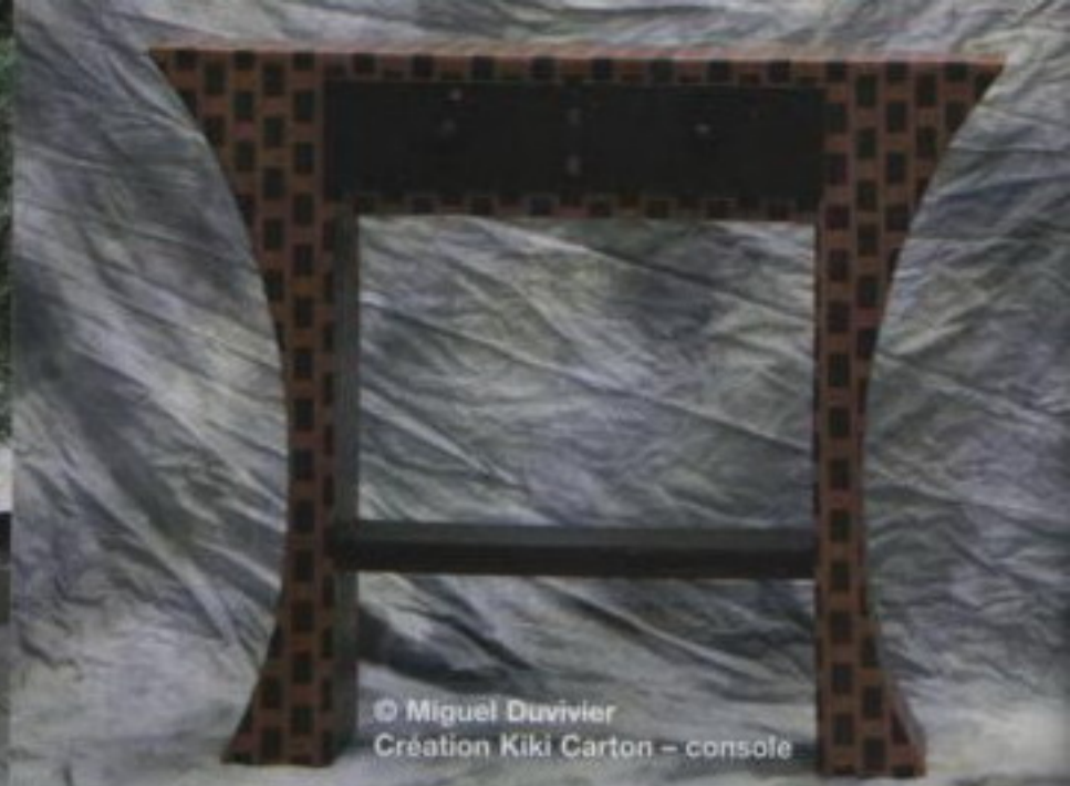
© Miguel Duvivier Création Kiki Carton - console

participer pour apprendre les techniques de création. Vous trouverez également sur Internet des sites consacrés à cette technique. La plupart sont très bien conçus et vous indiqueront comment débiter. Le carton est plus facile à travailler que le bois, adaptable à toutes les fantaisies et à tous les espaces. Le seul outil requis est le cutter. Armez-vous de patience, car il ne faut pas compter ses heures pour réaliser son premier meuble. Mais quelle fierté de contempler la table basse que vous aurez réalisée de vos propres mains ! Ajoutez à cela que vous pourrez personnaliser votre mobilier et l'adapter au style de votre logis.