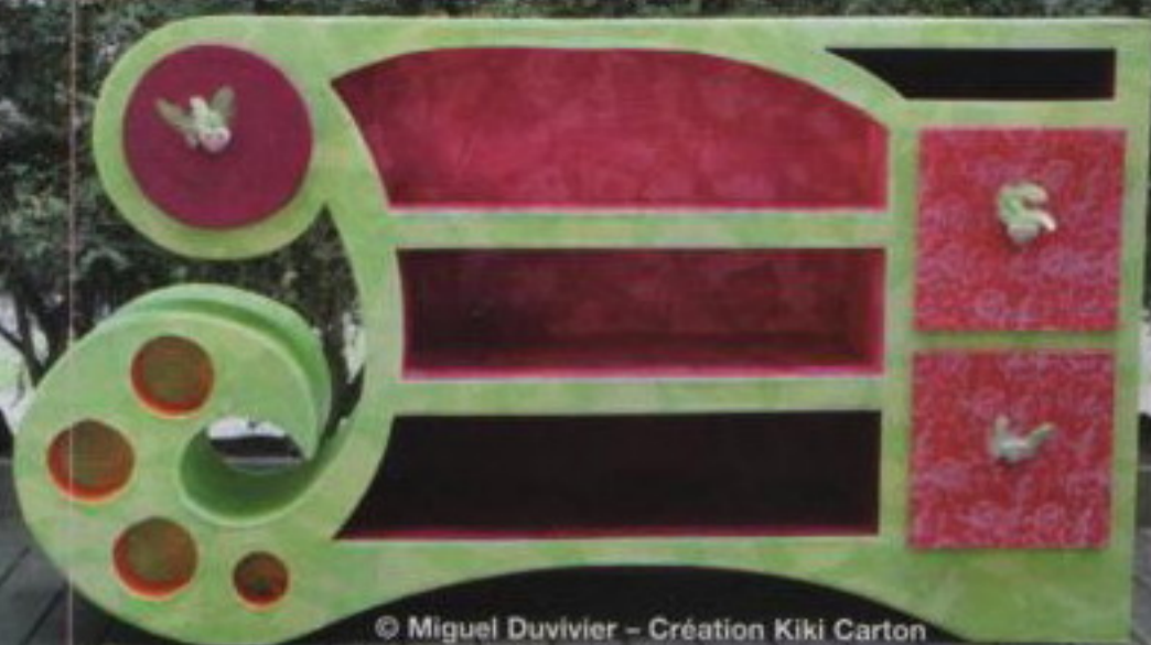
© Miguel Duvivier - Création Kiki Carton commode asymétrique